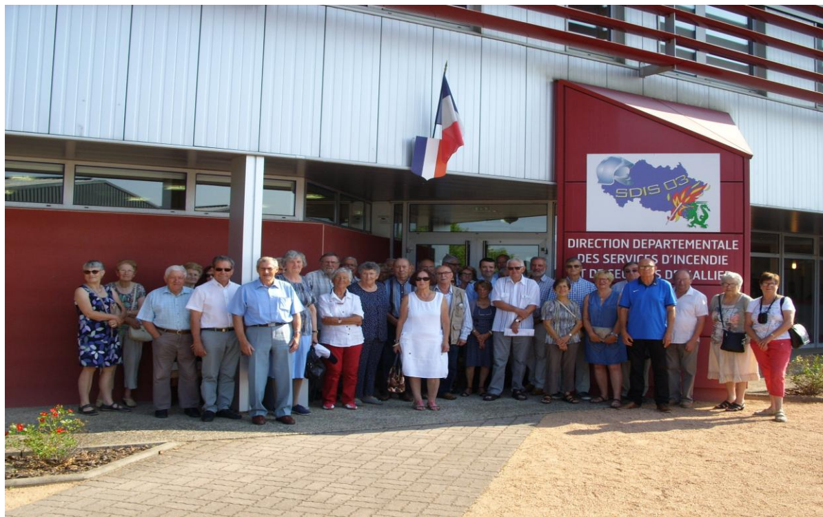
Photo réalisée lors de la Journée rencontre du 21 juin 2017 au SDIS de l'Allier