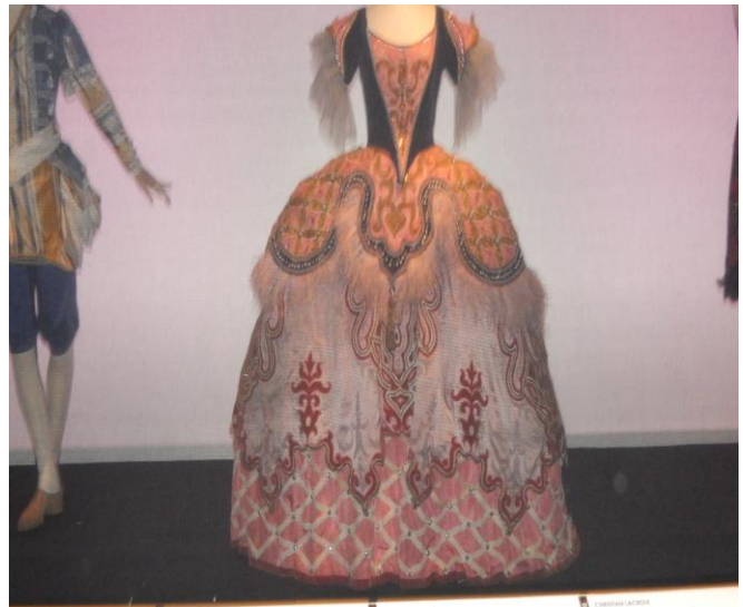
Exposition lors du 21 juin 2017