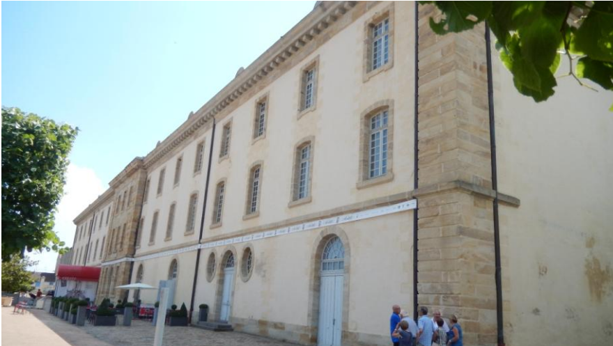
L'entrée du CNCS

Nous avons pu découvrir la robe de ville de fin 18ème et l'histoire de son passage de la ville au théâtre. Après cette présentation intéressante, particulièrement pour les dames, nous avons pu visiter librement l'exposition. Un très bon moment à l'ombre par cette journée de canicule.